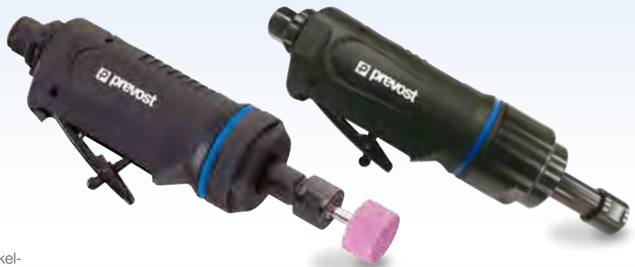
TDG S22000 (Schleifkörper als Option)

TDG S04000: Trennschleifen, Rund- und Winkelschleifen, Fräsen, Entschichten, Kantenschliff. Drehzahlbegrenzung gegen Überhitzung.